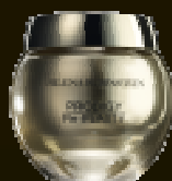
Peel-solution LHA (0,35%) - FPS10, UVA++

LISSAGE INTENSE - ANTI-RIDES PROTECTION UVB 10/ PA +++